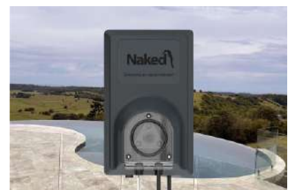
Option : Naked pH Controller